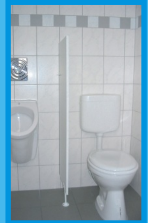
L 460 SW